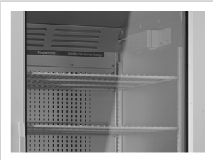
Beste Übersicht durch Glastür Gewährt das Beobachten der Messeinrichtungen.